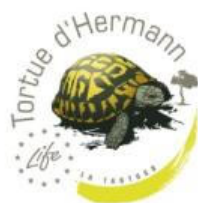
Biodiversité et espaces naturels