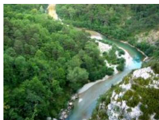
Assainissement et Milieux Aquatiques