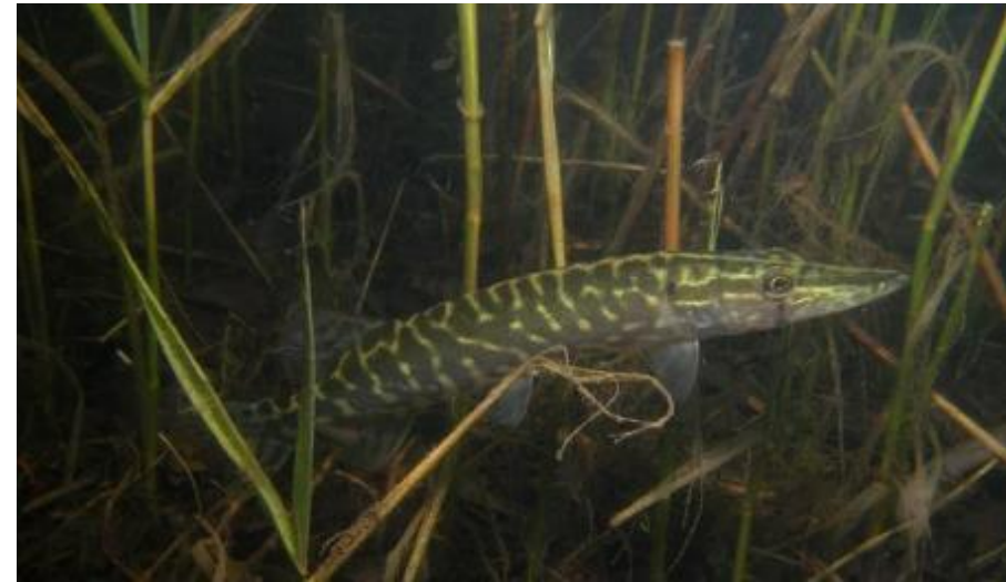
Brochet Esox lucius