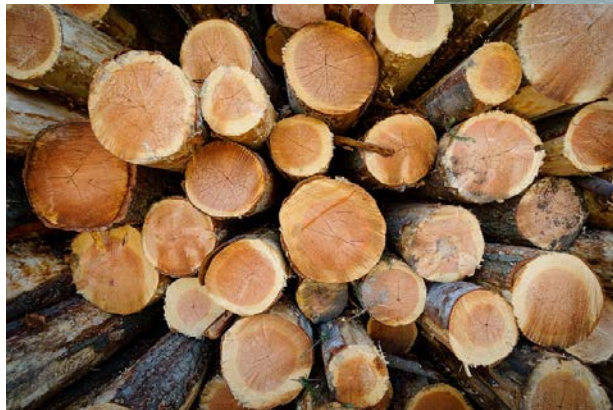
lutte contre la déforestation importée