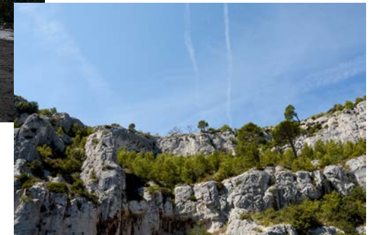
arrêtés « aires protégées »