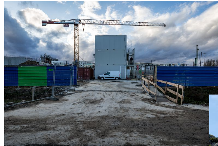
actions perspective zéro artificialisation nette