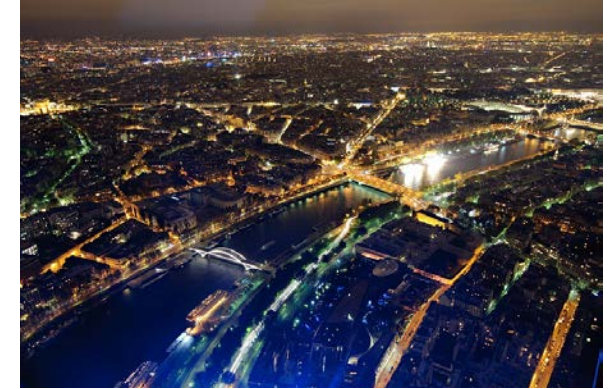
arrêtés « nuisances lumineuses »