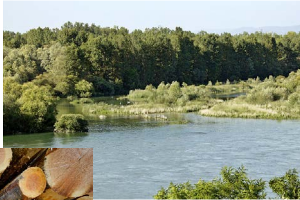
rapport sur les zones humides