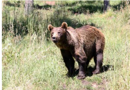
réintroduction de 2 ours