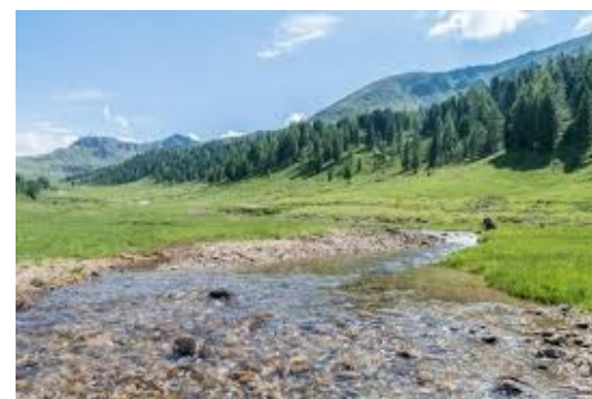
Une tête de bassin versant