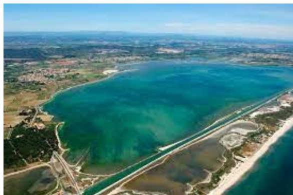
Une lagune méditerranéenne