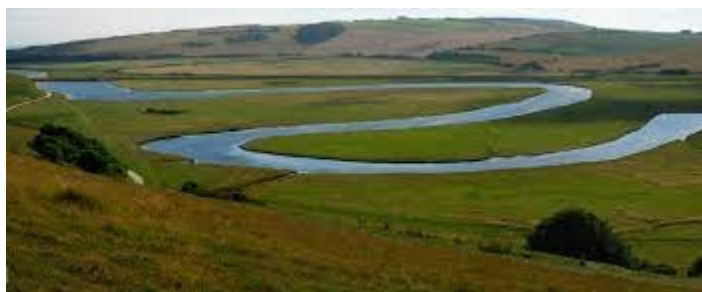
Un cours d'eau de plaine agricole