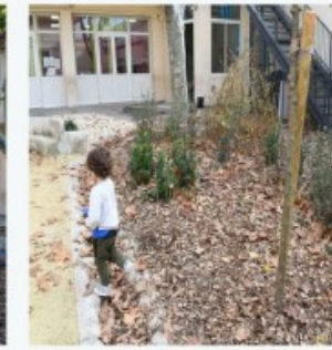
ÉCOLE SAINTE SOPHIE