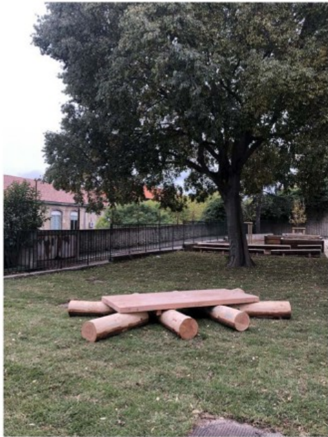
ÉCOLE RÉVOLUTION JET D'EAU