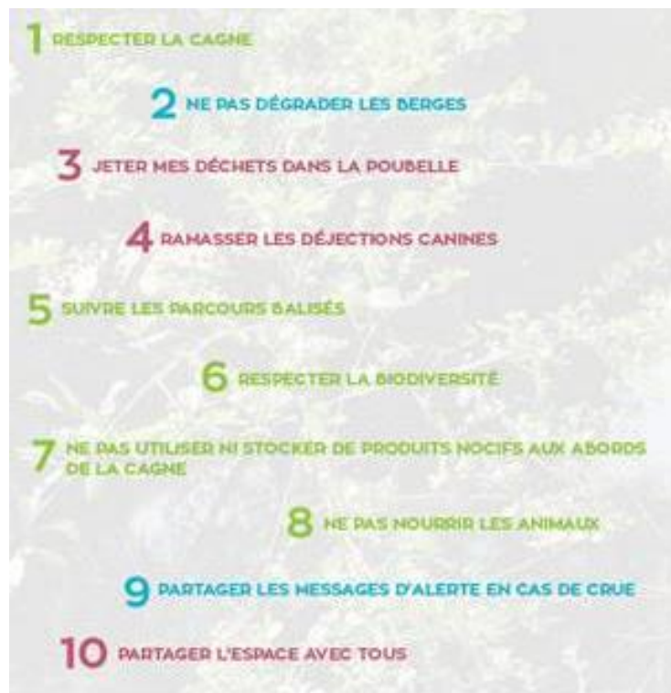
Charte éthique pour les promeneurs du long de la Cagne, d'après les propositions faites par les Cagnois lors des ateliers